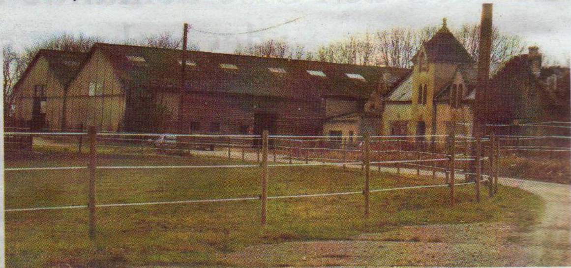
C.R Horse Training a trouvé sa place sur l'ancienne usine de petits pois. Les chevaux ont cinq hectares de prairie pour s'ébattre chaque jour de l'année.